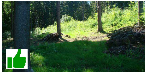
Iný príbeh: palivo z haluziny poctivo vychystané vlastníckmi lesa na Praženkovej.