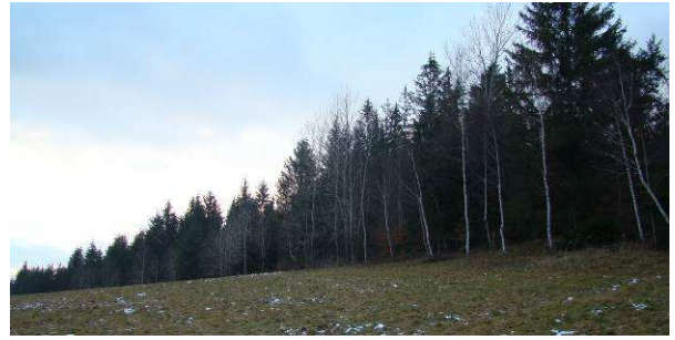
Okraj lesa porastený brezami býva v lete dobrý na kozáky a černice.