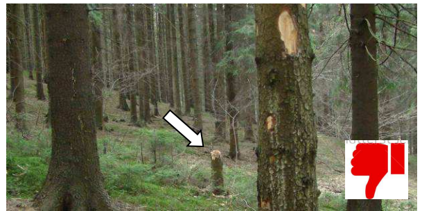
Najprv si strom sekerkou označia, a keď ho zrúbu, nechajú peň vo výške pásu. Aj to sú Kolibiská.