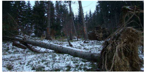
Jesenná víchrica neobišla ani túto oblasť – vyvrátené a naklonené stromy musia ísť preč.