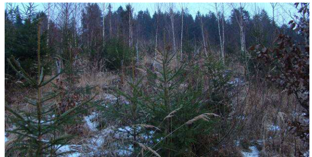
Nový zmiešaný les sa dvíha na kalamitnej holine. Cyprichov zárubok.