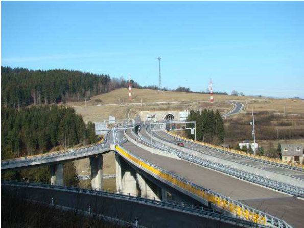
Západný portál diaľničného tunela Svrčinovec pribudol na Kolibiskách len nedávno.

Po Závriší a Kýčere sa dostávame na druhú stranu doliny Čierňanky – severnú, napravo od Šlahorovho potoka. Keď rastú, býva tam viac ľudí ako hríbov. V lete aj v zime partie výletníkov mieria cez Buky na Studeničné alebo Gírovú. Kolibiská sú asi najrušnejšou časťou svrčinovských lesov, Praženková naopak najtichšou.