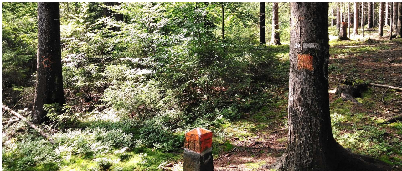
Hranica LPS Svrčinovac nad Strýčkovým potokom (Kolibiská)